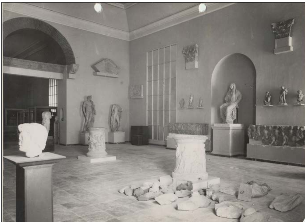
Figura 4: Sala de Roma, según la reordenación dada por José María de Navascués en 1954