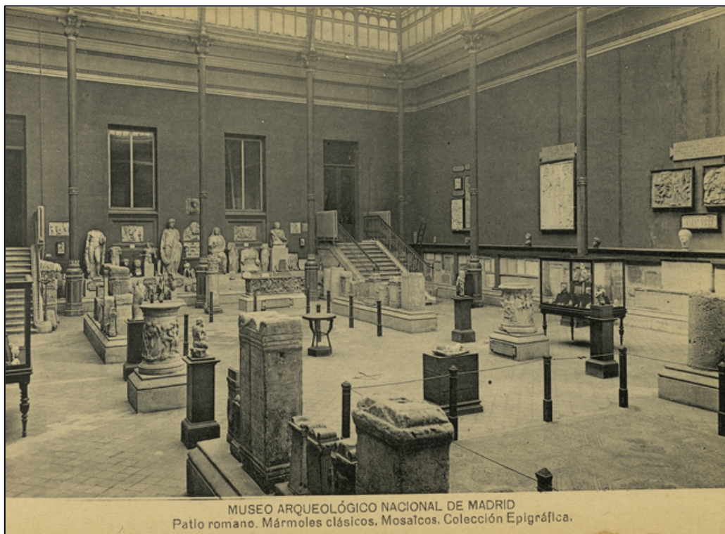
Figura 2: Museo Arqueológico Nacional. Patio romano. Mármoles clásicos. Mosaicos. Colección Epigráfica. Tarjeta postal Fototipia de Hauser y Menet. Madrid, ca. 1905. BNE, 17/TP/37