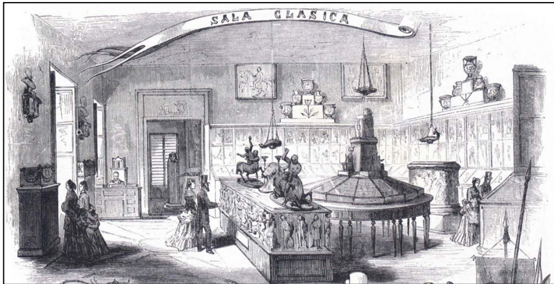
Figura 1: Sala de Arqueología Clásica, en el Palacete del Casino de la Reina (1867), La Ilustración Española y Americana , nº 33, 1872, pp. 520-521.

recubiertos con bóvedas de vidrio climático que va cambiando en undión de la intensidad lumínica.