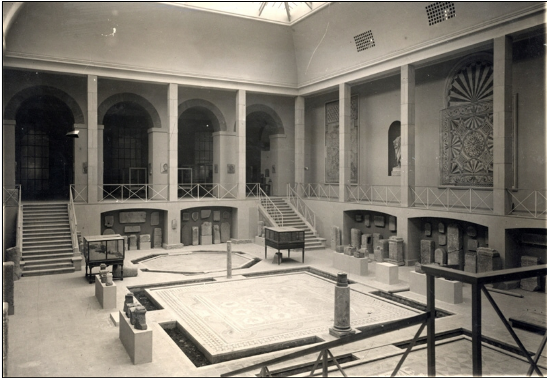
Figura 3: Remodelación del Patio Romano del MAN durante el denominado “Museo Breve” (1940-1951).