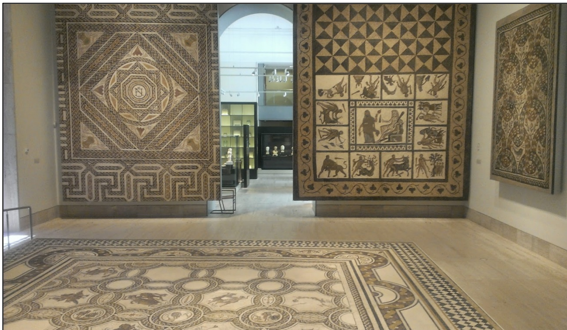
Figura 7: Vista de los mosaicos de la Sala 22 del Museo Arqueológico Nacional.

c) Las villas hispanorromanas, son el último apartado de la exposición, y se ubica en la Sala 22. Junto a diversos materiales cerámicos que reflejan las actividades económicas de estas edificaciones, diferenciándose en el dis-