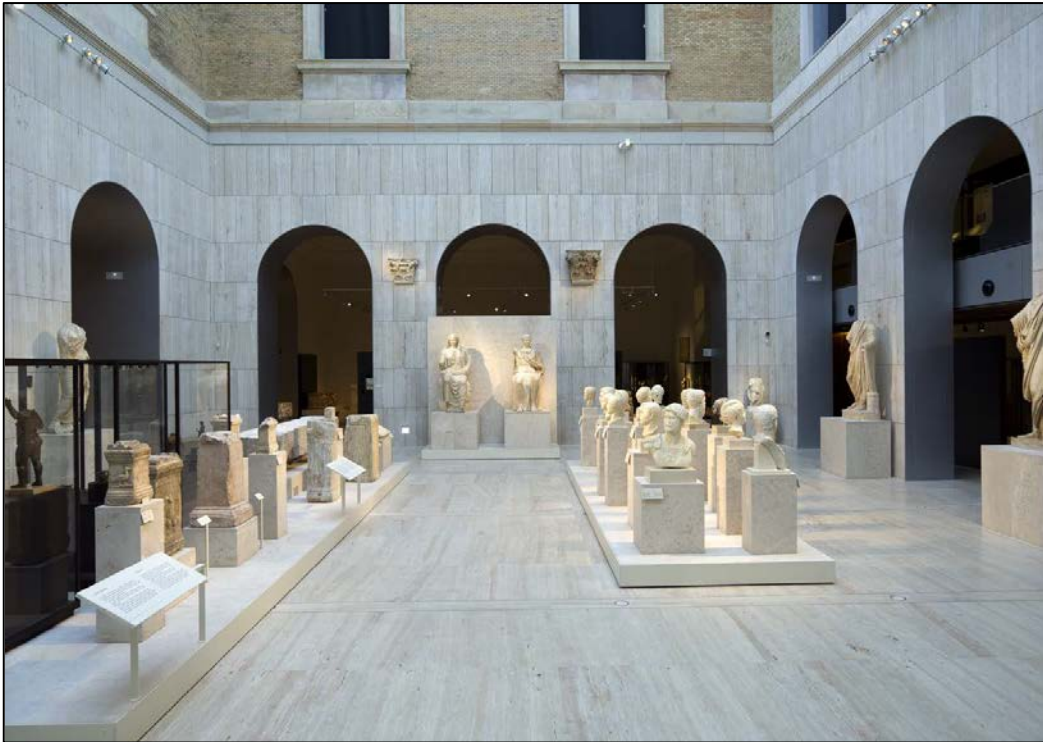
Figura 6: Vista de la Sala 20 del Museo Arqueológico Nacional, donde se ha recreado un foro romano.