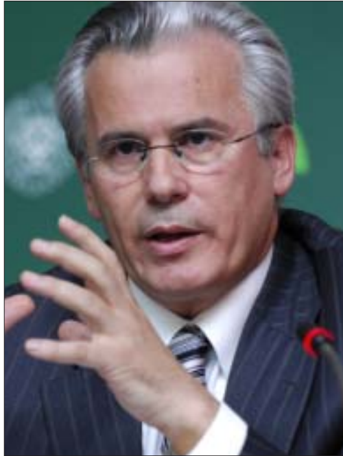
Baltasar Garzón dirige un curso.