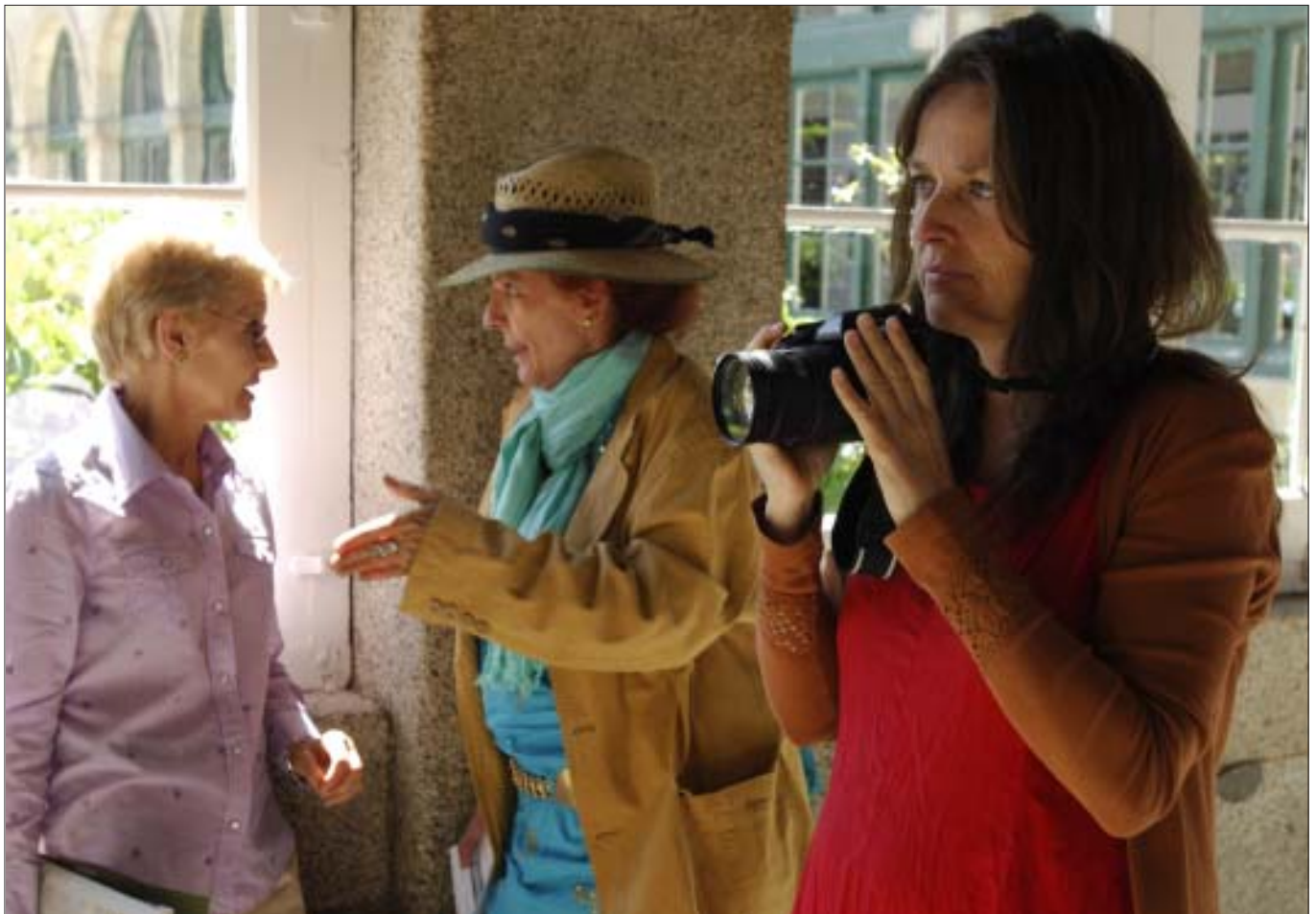
Bárbara Allende Gil de Biedma, más conocida como Ouka Leele, impartió un taller de fotografía en la anterior edición de los Cursos de Verano.

El cartel de la edición 2008 tiene nombre de mujer: Bárbara Gil de Biedma, conocida artísticamente como Ouka Leele. Quizá, según sus palabras, se esperaba de ella una fotografía, no en vano es Premio Nacional 2005; sin embargo, no fue ésta su elección: cogió sus pinceles y pintó un hermoso óleo. Unas flores sobre fondo negro expresan la noche y el día de esta actividad estival. Fotógrafa, pintora, poetisa, su vida está llena de intensos y misteriosos momentos, como su nombre que, tomado de una constelación inventada de El Hortelano, resultó tener un significado: dar la vuelta al círculo de la vida.