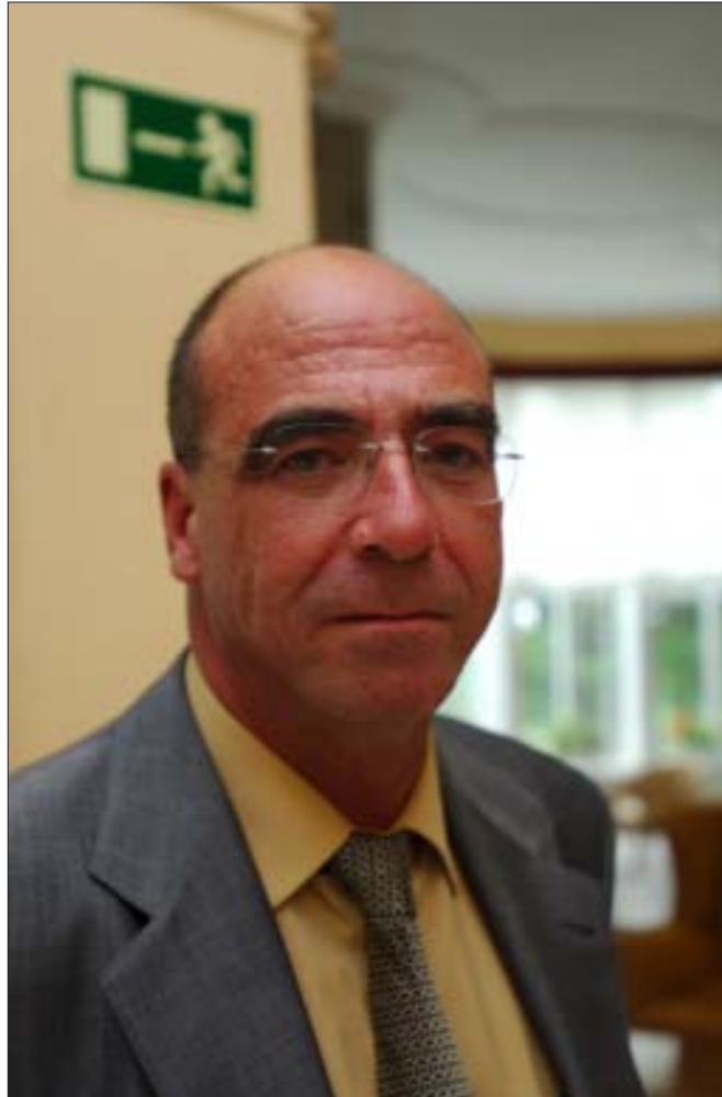
El director de los Cursos detalla las novedades de la programación 2008

Está presente en la propia programación. Quisiera destacar dos cursos que celebran conmemoraciones en relación con el mundo de la mujer: uno es el Centenario de Simone de Beauvoir; y otro es el Centenario del 8 de marzo, la conmemoración del Día Internacional de la mujer trabajadora. El 8 de marzo de 1908, unas 125 mujeres murieron en la Cotton Textile