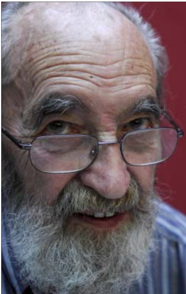
Los Cursos homenajean al poeta ovetense Ángel González, recientemente fallecido.

Los edición 2008 conmemora importantes efemérides como los 30 años de la Constitución; 100 años del 8 de marzo y la Igualdad en el mundo del trabajo; 50 aniversario de las becas Fulbright; Centenario de la Casa del Pueblo; 60 aniversario de la Declaración de los Derechos Humanos o 200 años de la Guerra de la Independencia. Los Cursos de Verano cuentan con el patrocinio general de Caja Madrid y la financiación específica de 200 instituciones públicas y privadas.